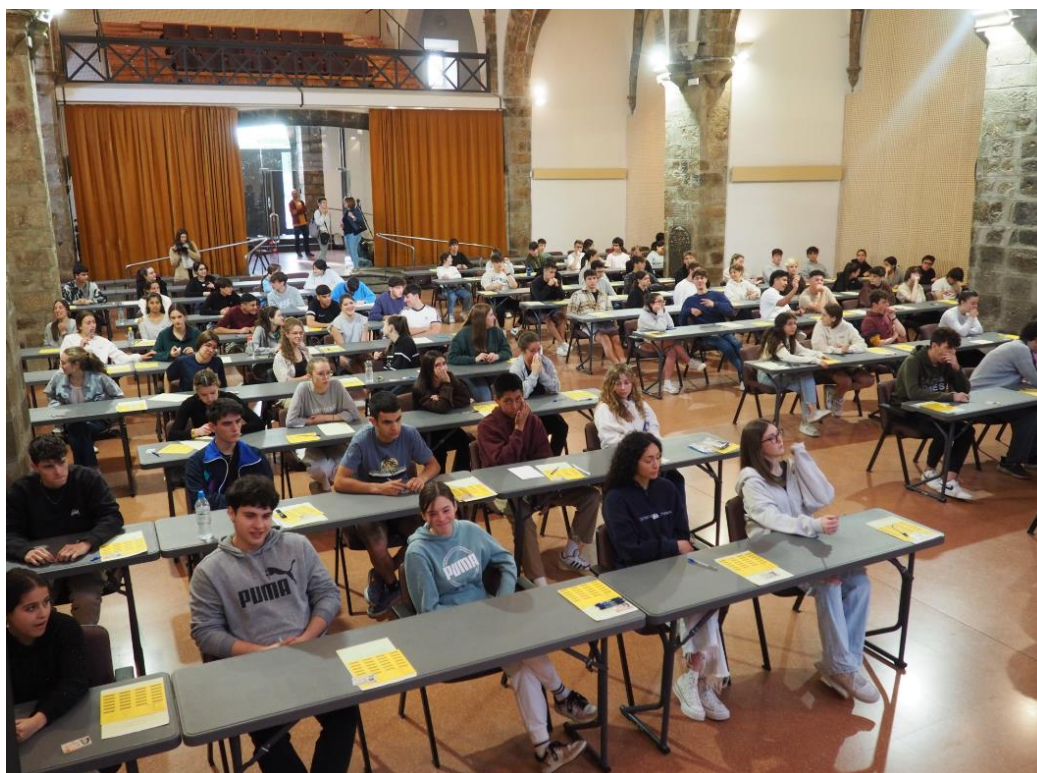
La Seu d'Urgell, 26 de juny de 2023

En total, a Catalunya hi ha hagut 1.153 estudiants, 699 noies i 454 nois, que han obtingut una nota igual o superior a 9 (1.409 l'any 2022), entre d'ells 5 alumnes (dos noies i tres nois) de l'Institut Joan Brudieu, una de la modalitat d'Humanitats i ciències socials i els altres de la modalitat de Ciències i tecnologia. Aquests joves rebran les distincions que atorga el Govern de la Generalitat als estudiants amb millor nota.