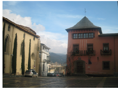
Ajuntament de la Seu d'Urgell (1933)