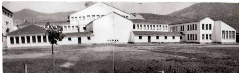
L'Institut, al carrer Iglesias Navarri (1960)