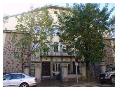
Ampliació de l'Institut, al carrer Iglesias Navarri (1999)