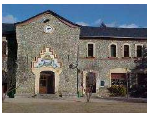
Escola Pere Sarret Martinet