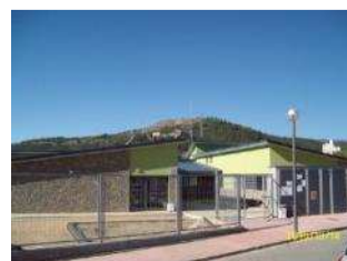
Escola Rosa Campà Montferrer