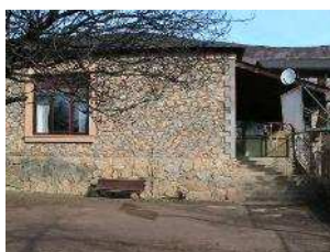
Escola el Puig Prullans