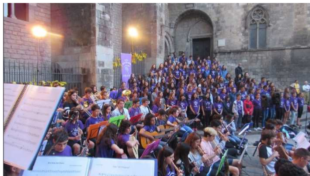
Coral i orquestra de l'Institut