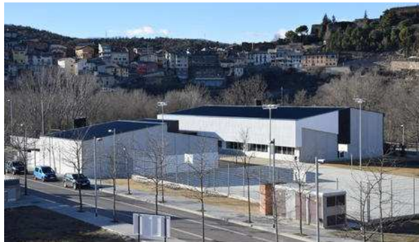
Institut La Valira La Seu d'Urgell