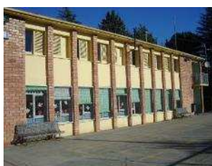
Escola Castellciutat Castellciutat