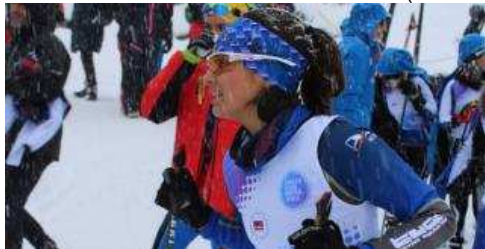
Esquí de Fons