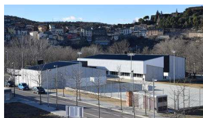
Escola La Valira La Seu d'Urgell