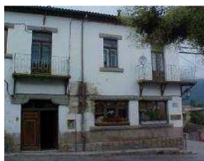
Escola Portella Blanca Lles de Cerdanya