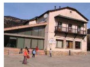
Escola de Tuixén Tuixén