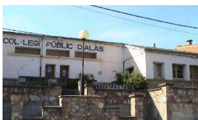
Escola Sant Esteve Alàs

L'Institut Joan Brudieu, creat l'any 1933, és l'institut públic d'ensenyament secundari de referència de la comarca de l'Alt Urgell. Per als estudis d'ESO, té adscrites gairebé la totalitat de les escoles públiques de la comarca de l'Alt Urgell, excepte les situades al sud de la comarca, en els municipis de Peramola, Oliana i Bassella, i també té adscrites les escoles més occidentals de la comarca de la Cerdanya, la dels municipis de Montellà i Martinet, Lles de Cerdanya i Prullans, tots pertanyents a la província de Lleida. Concretament, l'Institut Joan Brudieu té una zona d'escolarització força extensa i que es concreta en: