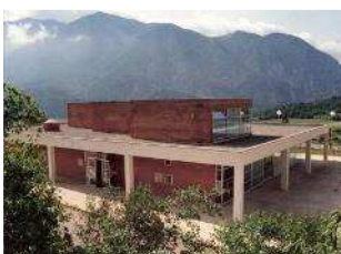
Escola Sant Climent Coll de Nargó