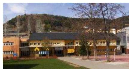
Escola Pau Claris la Seu d'Urgell