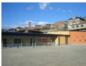
Escola Arnau Mir el Pla de Sant Tirs