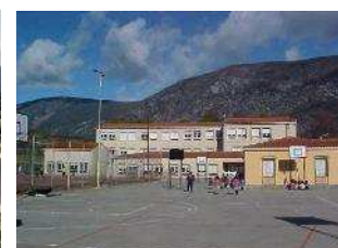
Escola Miret i Sans Organyà