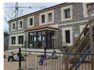
Escola Ridolaina Montellà