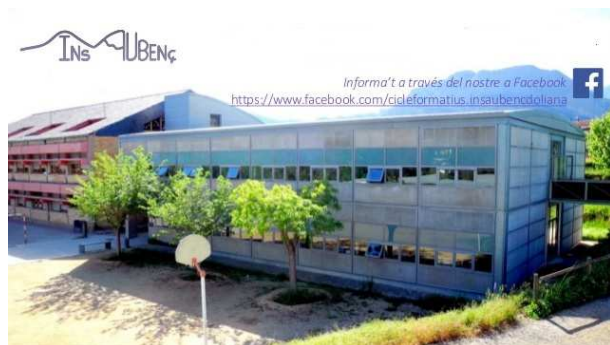
Institut Aubenç Oliana

L'Institut Joan Brudieu, per als estudis de BTX (modalitats d'Humanitats i de Ciències i tecnologia), té adscrit l'Institut Aubenç, d'Oliana i l'Institut La Valira, de la Seu d'Urgell.