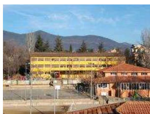
Escola Mossèn Albert Vives la Seu d'Urgell