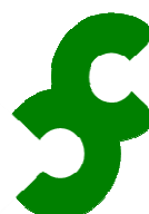
circuits locals (visita de punts d'interès locals fora del camí troncal o brançal)

Indicador de pas barrat (camí equivocat):